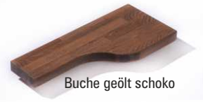
Buche geölt schoko