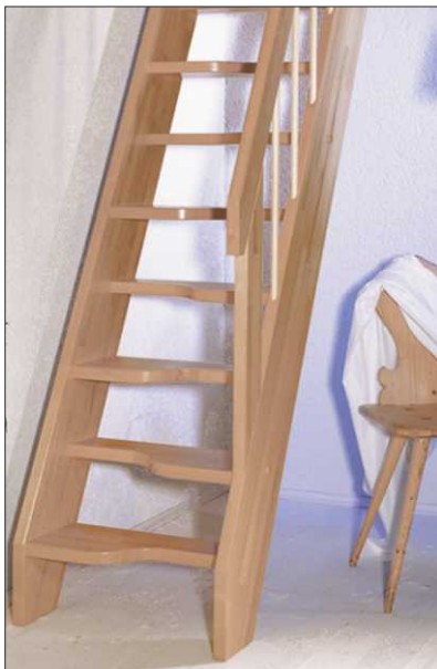
topstep mit geschwungenen Stufen; Geländer