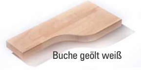
Buche geölt weiß