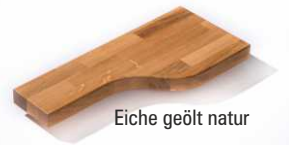
Eiche geölt natur