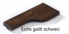
Eiche geölt schwarz