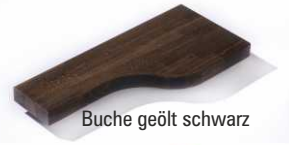
Buche geölt schwarz