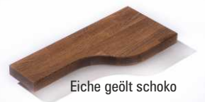
Eiche geölt schoko