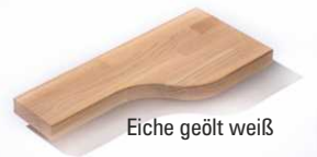
Eiche geölt weiß