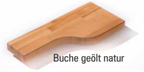
Buche geölt natur