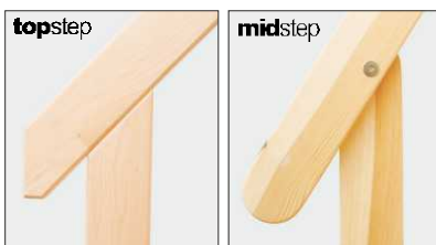
Geländer wangenbündig / angeschraubt